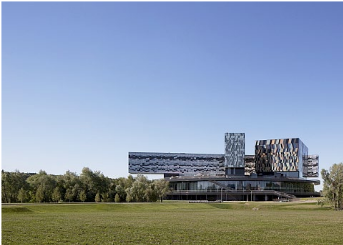
david adjaye, school of management, moskau

die vorgefertigten wohnelemente aus beton, die im ehemaligen olympischen frauendorf von 2007 bis 2009 neu aufgebaut wurden, werden heute von studenten bewohnt.